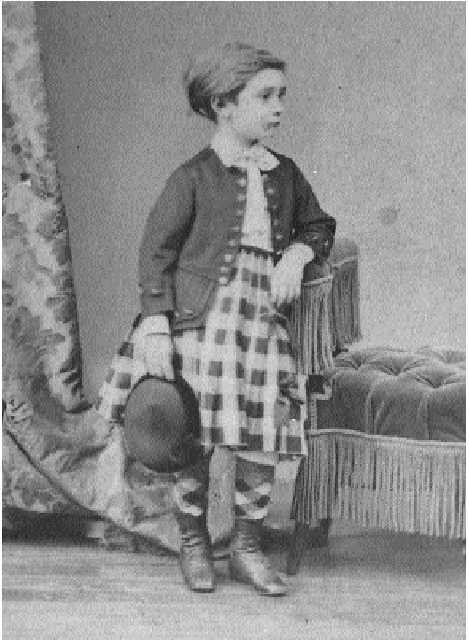
Photo de Pierre de Coubertin enfant