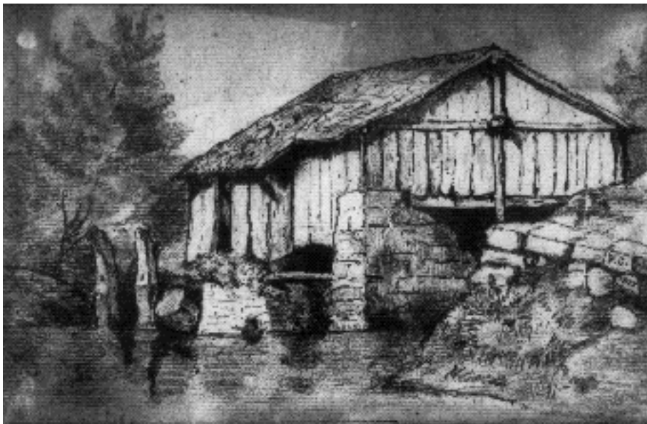
Grange sur la rivière. Dessin de Pierre de Coubertin.