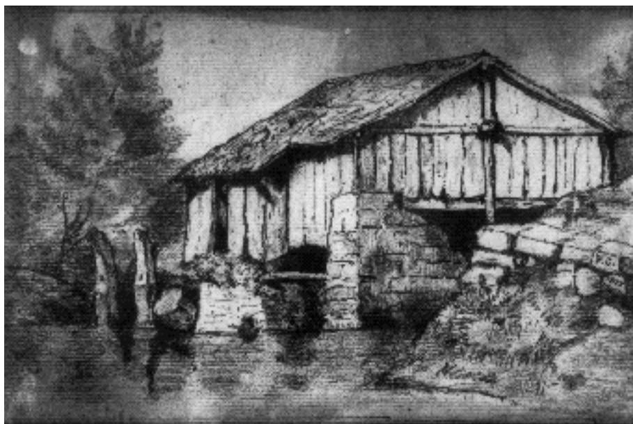
Grange sur la rivière. Dessin de Pierre de Coubertin.