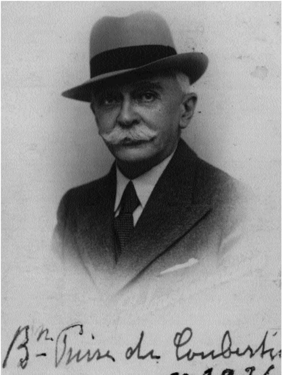
Photo de Pierre de Coubertin donnée par sa femme à mon père (Christian de Navacelle de Coubertin) avec sa signature en bas.